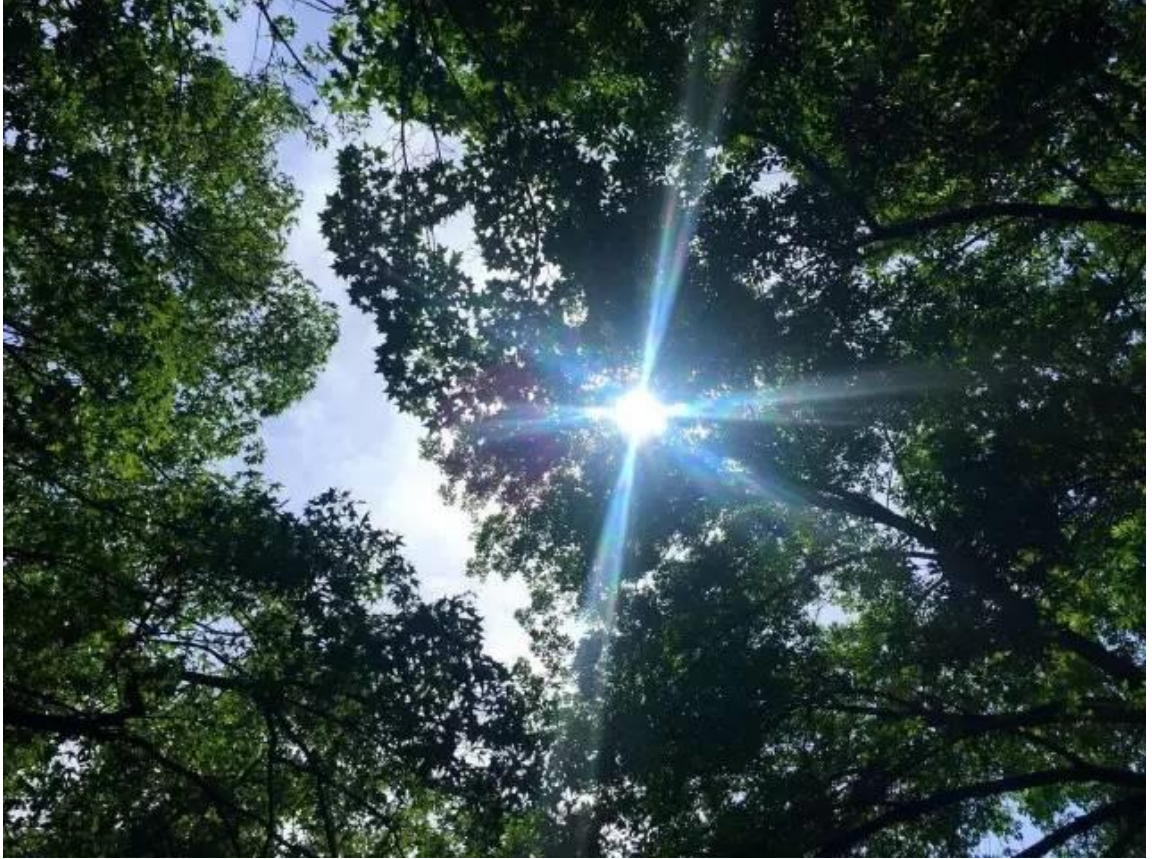
阳光透过树叶，温柔地照耀着。