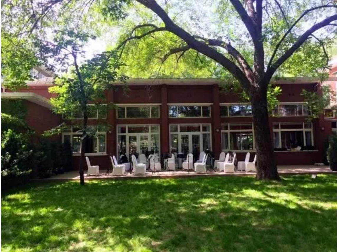
演出的场地是使馆办公区域后面的小草坪。红墙绿叶，树影斑驳。