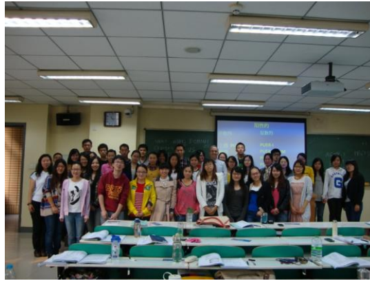
BFSU beginners class 2