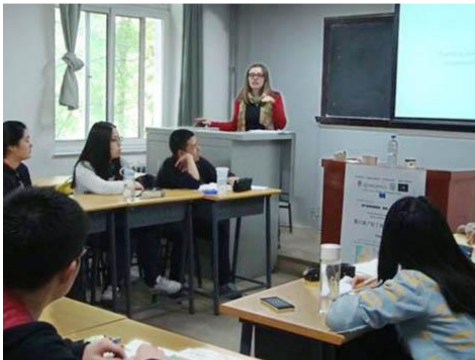
拉丁语言文化中心举办“拉丁语与葡萄牙语”讲座

为促使广大师生进一步了解拉丁语在西方语言文化中的位置，本学年，北京外国语大学中国海外汉学研究中心拉丁语言文化中心特组织“拉丁语与欧洲语言：历史、语法、语言学”系列讲座，介绍拉丁语之于意大利语、法语、西班牙语、葡萄牙语、罗马尼亚语、英语、德语等现代语言的影响。